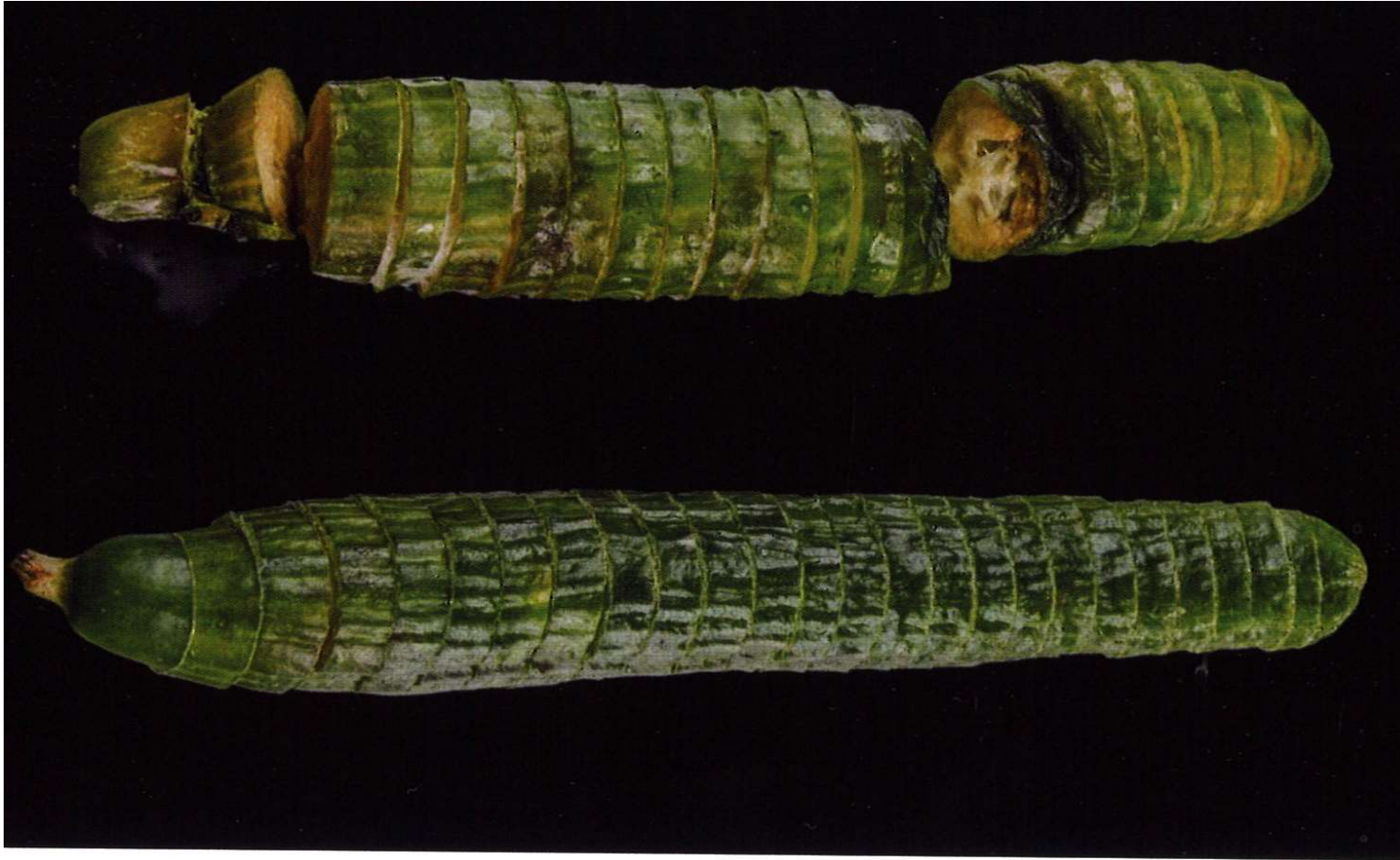
Komkommers na 16 dagen. Boven, gangbare komkommer. Onder, biodynamische komkommer