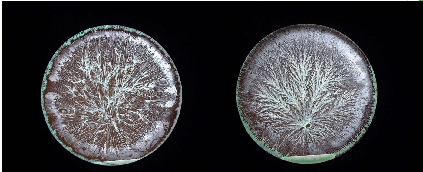
Gangbare appelsap (helder)